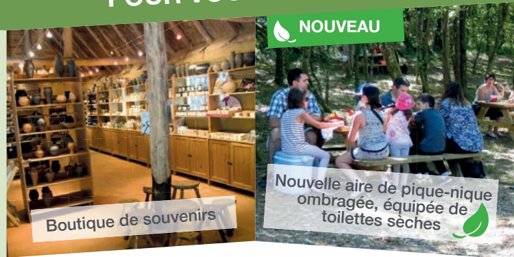
Boutique de souvenirs