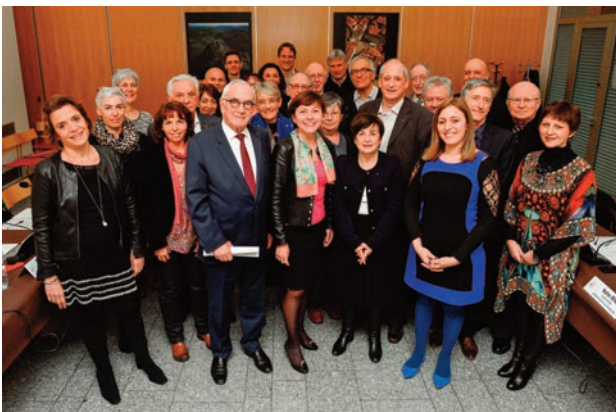
Comité du nom de la Région, 23 mars 2016

Celle-ci a permis de recueillir l'avis des acteurs institutionnels du territoire et de déterminer une liste de noms possibles avec la saisine du CESER et la consultation des élus, des chefs d'entreprise et des organisations représentatives. Sur proposition du Bureau de l'Assemblée, un « Comité du Nom de la Région » a été créé. Il était composé de 30 membres issus de la société civile et de tous les territoires et respectant la parité hommes/femmes, afin d'éclairer l'institution régionale dans sa réflexion, de débattre d'un nouveau nom, de suivre la mise en place de l'ensemble du processus de consultation et de formuler des avis sur l'ensemble de la démarche. Le Comité du Nom sous l'animation de Martin Malvy, ancien Président de la Région Midi-Pyrénées, a proposé une première liste de 8 noms sur la base des retours institutionnels et des milliers de suggestions citoyennes recueillies sur le site Internet de la Région.